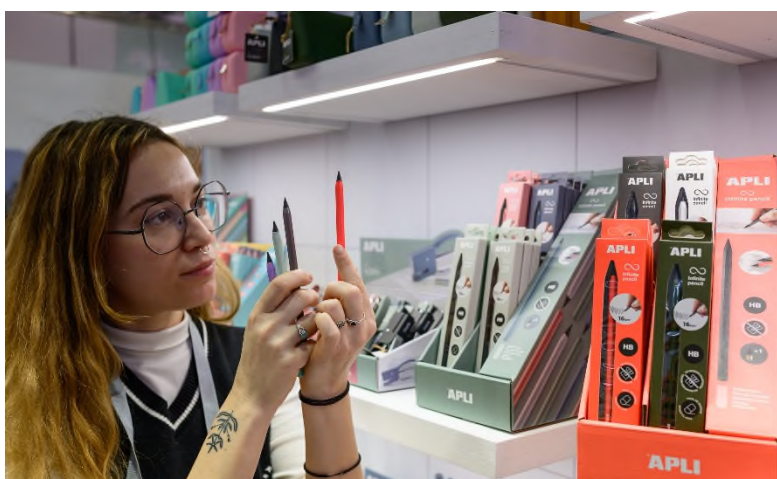
Der Infinite Pencil von Apli verfügt über eine ersetzbare Grafiks Spitze, die 16 km lang schreibt – ohne Abbrechen oder Anspitzen.

Trotz Klassenchat, Tablet & Co. rückt das Handschreiben wieder verstärkt in den Fokus. Studien bestätigen: Wer mit der Hand schreibt, lernt schneller lesen und schreiben und merkt sich die selbst notierten Inhalte besser. Wie unterhaltsam Schreiben sein kann, zeigt die italienische Marke Legami , die mit ihren löschbaren Gelstiften einen wahren Hype ausgelöst hat. Auf der Ambiente 2025 präsentierte sie nicht nur neue Tier-Charaktere, sondern auch durchsichtige Monster-Mäppchen, die den Blick auf die eigene Stifte-Sammlung freigeben. Eine clevere Lösung für Bleistiftfans hält die spanische Marke Apli bereit. Der „Infinite Pencil“ in angesagten Neonfarben verfügt über eine ersetzbare Grafiks Spitze, die 16 km lang schreibt – ohne Abbrechen oder Anspitzen.