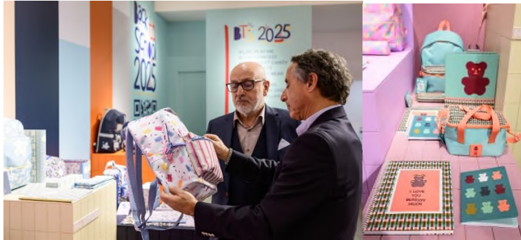
Ancor stattet Ranzen, Collegeblocks, Hefte, Mäppchen & Co mit Extras aus: von der Glitzerapplikation bis zum Bärchen, das duftet, wenn man es reibt.

Auch Yolo begeistert mit knallbunten Farben und frischen Meeresmotiven, während DKT mit Marshmallow- und Limonade-Designs für gute Laune sorgt. Für Schüler*innen höherer Jahrgänge sind die stylischen Rolltop-Rucksäcke der New Rebels-Kollektion von Like it a lot oder von Zwei eine beliebte Alternative. Ihr durchdachtes Innenleben hilft, den Schulalltag optimal zu organisieren.