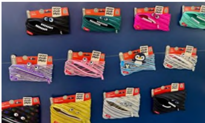
Zipit begeistert mit unerwarteten Details und Extrafunktionen.

Mit Spaß beim Lernen und Ordnung halten? Kein Problem dank zahlreicher smarter Produkte. Kikkerland bietet zum Beispiel ein vielseitiges Portfolio – vom Buch- und Seitenhalter aus Holz bis hin zu Sticky-Notes, die wie eine Blumenwiese aus dem Buch wachsen. Die spanische Marke Milan hat sich von ihren ikonischen Radiergummiklassikern zu mehreren Kollektionen inspirieren lassen, darunter ein perfekt organisiertes Buntstifte-Mäppchen für angehende Künstler*innen. Ordnung auf den Schreibtisch bringt auch die „Pencil Box“ von OMY in cooler Stifform. Diese lässt sich durch einen einfachen Klick-Mechanismus öffnen und schließen. Apropos Schließen: Die israelische Marke Zipit überrascht mit kreativen Reißverschluss-Designs, darunter Monster-Mäppchen, die beim Öffnen "Zähne" zeigen.