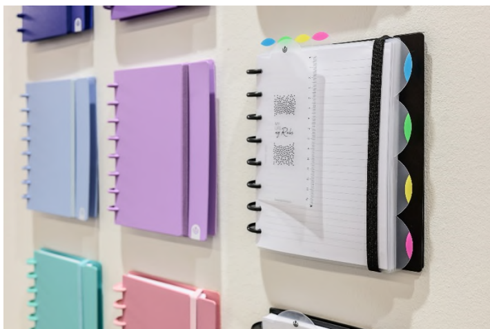
Die Ringbücher von Carchivo lassen sich problemlos erweitern und individualisieren.

Auch andere Hersteller arbeiten eng mit Schulen zusammen. So haben die innovativen Ringbücher von Carchivo es auf die Materialisten vieler spanischer Schulen geschafft. Das einzigartige Plättchen-System erlaubt es, das Ringbuch problemlos zu erweitern und zu individualisieren, sodass alle Schulfächer in einer Mappe Platz finden. Das feste Cover schützt den Inhalt, so sind Stundenplan, Hausaufgaben und Notizen immer zur Hand und sicher verstaut.