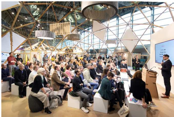
New Work hat viele Gesichter – let's talk in der Future of Work Academy in Halle 3.1 im Bereich Ambiente Working bei Office Design & Solutions.

Frankfurt am Main, November 2024. Die Arbeitswelt ist im Umbruch, KI auf dem Vormarsch, nachhaltige Lösungen gefragter denn je: New Work hat viele Gesichter – let's talk! Renommiertere Referenten diskutieren diese Aspekte und viele mehr auf der Future of Work Academy. Neu: Erstmals gestaltet der bdia das Programm des Interior Designer Days am Messesamstag. Zusätzlich führen Guided Tours zu ausgewählten Ausstellern, die smarte Interior sowie Office Design-Lösungen anbieten.