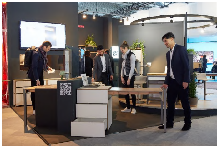
Office Design & Solutions und das Areal Future of Work ziehen auf die Ostseite der Halle 3.1 im attraktiven Design-Umfeld.

Premiuranbieter*innen von intelligenten Einrichtungskonzepten für das klassische Büro, Co-Working-Spaces, Homeoffices sowie für das mobile und hybride Arbeiten finden unter dem neuen Titel „Office Design & Solutions“ weiterhin ihr Zuhause in einem attraktiven Interior Design Umfeld. Sie ziehen allerdings auf die Ostseite der Halle 3.1 – näher zum Forum und zur Festhalle.