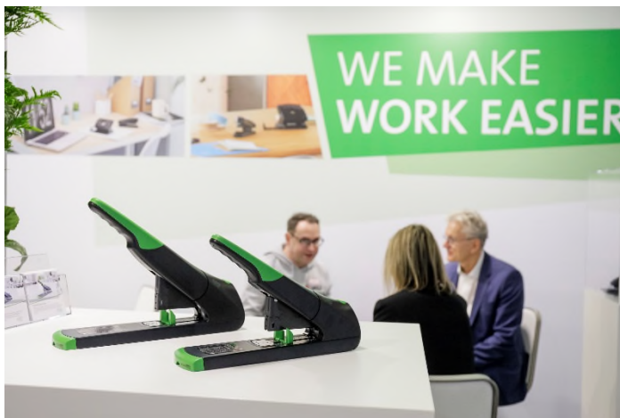
Namhafte Office-Anbieter für den gewerblichen Bürobedarf und -technik ziehen in die Festhalle und in das direkt angeschlossene Forum 0.

Das Office-Segment, mit Anbietern für den gewerblichen Bürobedarf und -technik (vorher in Halle 4.2), zieht zum einen in die Festhalle und zum anderen in das direkt angeschlossene Forum 0 auf der gleichen Ebene. Das Markenareal „Office Heroes“ wird im Forum 0 platziert in Zusammenarbeit mit dem Verband der PBS-Markenindustrie. Zu den bisher registrierten Ausstellern aus dem Kreis der PBS-Markenindustrie, die mit voller Stärke zurückkommen, zählen zum Beispiel Acme, Alco Albert, Casio, Durable, Go Europe, Han, Jakob Maul, Novus Dahle, Sigel oder Tesa. Firmen wie Clairefontaine, Schneiderpen oder Tombow präsentieren sich auf der parallelen Creativeworld in direkter Nachbarschaft.