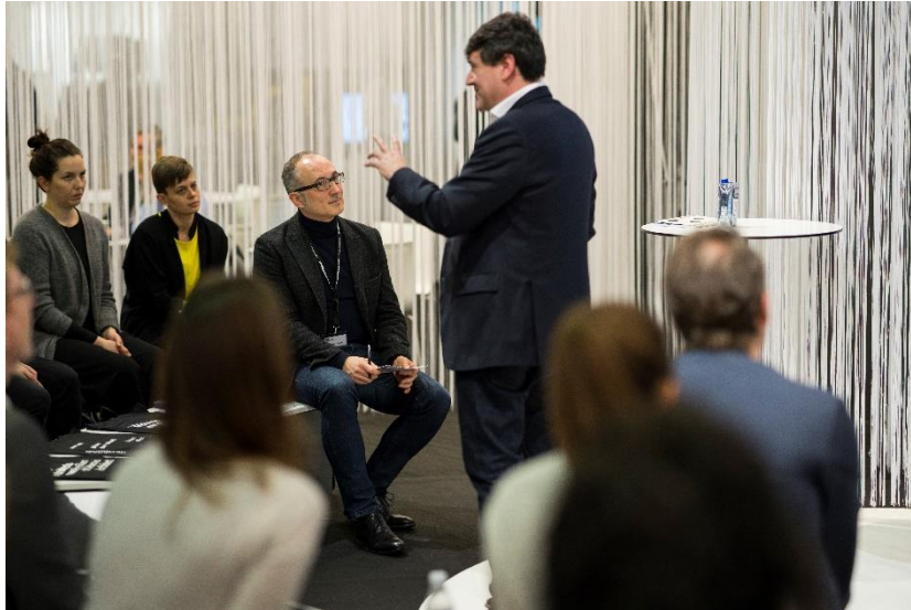
Zur Ambiente 2023 findet erstmalig das neue Vortragsprogramm Future of Work Academy statt

Das „ Future of Work Academy “-Programm hat täglich wechselnde Schwerpunkte.