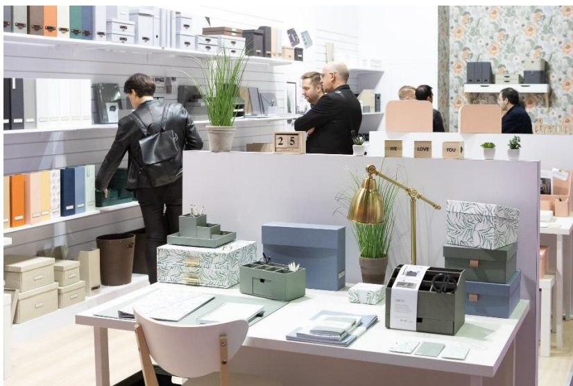
Halle 4.2: Der neue Treffpunkt rund um Papier-, Bürobedarf und Schreibwaren

Die neue Heimat der Office-Produkte rund um Bürobedarf, -ausstattung und -technik ist 2023 die Halle 4.2 bei Ambiente Working. Dort haben sich Firmen wie Durable, Herma, HSM, Novus Dahle und Schmidt Technology bereits einen Platz gesichert und präsentieren ihre Produktneuheiten in einem internationalen PBS-Umfeld. Ebenfalls in diesem Bereich befindet sich die „Insider-Lounge“, die eine erste Anlaufstelle für PBS-Facheinzelhändler bietet, welche von der Messe Frankfurt exklusiv eingeladen werden. Auch die EK Servicegroup, der PBS-Markenverband und die Prisma Fachhandels AG sind dort mit einem Stand vertreten und laden zum Networking ein. Das Sonderareal ist also der ideale Treffpunkt sowohl für Händler als auch für Markenfirmen, um sich über die neuesten Trends und Entwicklungen auszutauschen und neue Produkte kennen zu lernen.