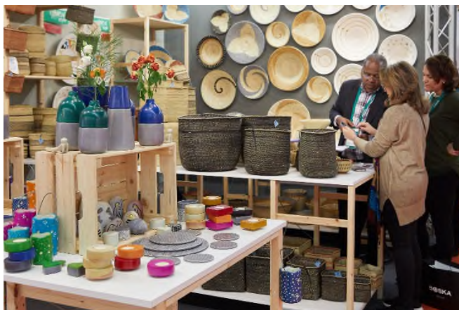
Einkaufen auf der größten Sourcing-Plattform außerhalb Chinas, Foto: Messe Frankfurt/Jean-Luc Valentin

„Mit der Bündelung des Angebots der beiden Leitmessen Ambiente und Christmasworld, das an einem Ordertermin abrufbar ist, schaffen wir wertvolle, neue Synergien und nie dagewesene Kontakt- und Geschäftsmöglichkeiten. Außerdem bieten wir so eine internationale Vermarktung und hohe Besucherfrequenz. Für Einkäufer*innen, die bisher nicht global gesourct haben, wird so ein unkomplizierter Zugang zu weiteren Märkten ermöglicht. Global Sourcing ist als größte verfügbare Sourcing-Plattform außerhalb Chinas ideal, um systematisch Kontakte zu knüpfen und Containergeschäfte mit den Herstellern abzuschließen“, so Philipp Ferger, Bereichsleiter Consumer Goods Fairs.