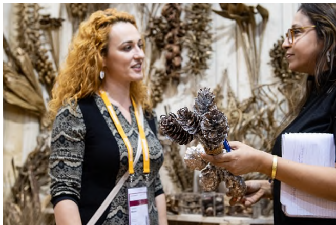
Internationale Produktvielfalt der Christmasworld in Halle 10.0 entdecken, Foto: Messe Frankfurt/ Pietro Sutura

Global Sourcing erstreckt sich auf der kommenden Ambiente über sechs Hallenebenen: 10.1 bis 10.4 und 11.1 für die Produktgruppen der Ambiente sowie 10.0 für die Christmasworld. In letzterer dreht sich im Bereich Christmas & Seasonal Decoration alles um Floristenbedarf über saisonale Dekoration, Weihnachtsprodukten bis hin zur Beleuchtung.