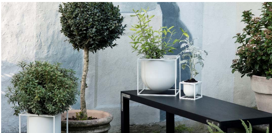
Zeitlos, klassisch und immer wieder neu: „Kubus Flowerpot“ und „Kubus Vase Nolia“ von by Lassen

Besucher und Hersteller überzeugt die Attraktivität der Ambiente, die mithilfe klug gesetzter Akzente der Konsumgüterwelt von morgen schon heute ein Gesicht verleiht. Auch 2019 werden wieder viele neue Aussteller willkommen geheißen. Hier ein erster Ausblick: